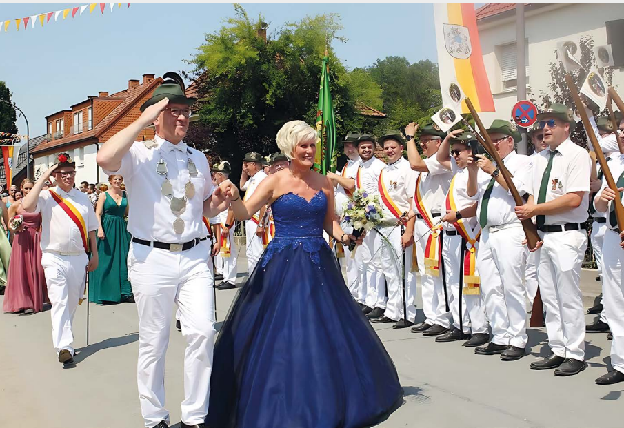
Der große Zapfenstreich war einer der feierlichen Höhepunkte des Festsonntags.