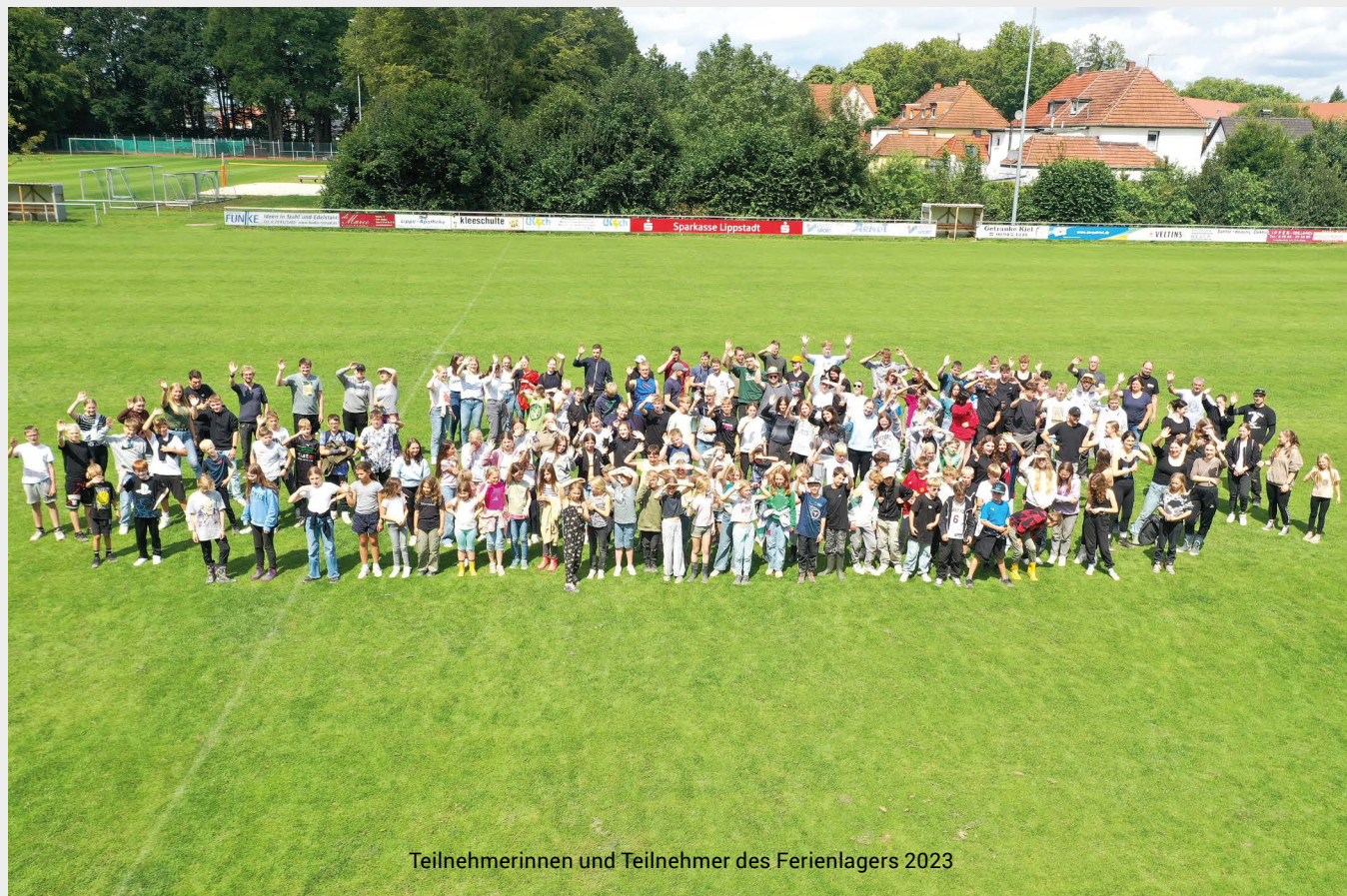
Teilnehmerinnen und Teilnehmer des Ferienlagers 2023