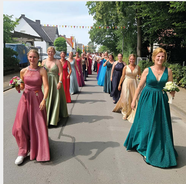
Die eleganten Kleider der charmanten Hofdamen konnten am Sonntag beim Festumzug bewundert werden.