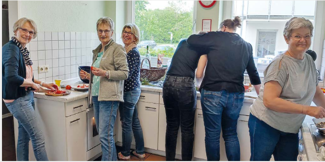
Foto oben/links.: Kräuter- sammlung mit anschließender Verkostung in der Michaelsburg