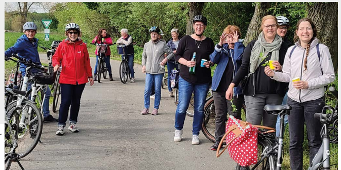
Fotos oben: Weiberkarneval / Foto unten: Traditionelle Fahrradtour